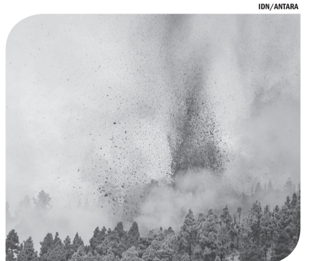
LETUSAN GUNUNG BERAPI DI SPANYOL Lahar dan asap terlihat saat terjadi letusan gunung berapi di taman nasional Cumbre Vieja di El Paso, Pulau Canary La Palma, Spanyol, Minggu (19/9).