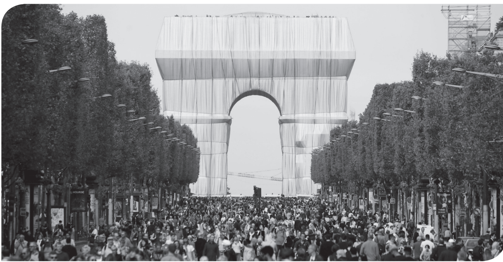
MONUMEN ARC DE TRIOMPHE PARIS

Orang-orang berjalan di dekat monumen Arc de Triomphe, terbungkus penuh sebagai bagian dari instalasi seni berjudul "L'Arc de Triomphe, Wrapped" yang digagas oleh mendiang seniman Christo dan Jeanne-Claude di jalan Champs Elysees selama minggu bebas mobil di Paris, Perancis, Minggu (19/9).